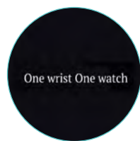
14 | The Angel Trade Commerce de montres Contact : Séraphin Seynave