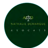
21 | Demarque Nathalie Avocate Avocate, conseiller en planification patrimoniale & successorale Contact : Nathalie Demarque