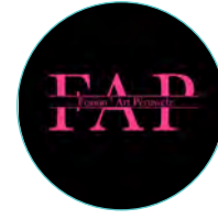
16 | Fusion'Art Peruwelz Ecole de danse Contact : Steve Fresu