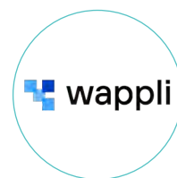
20 | Wappli Développement web & mobile Contact : Jérôme Renard